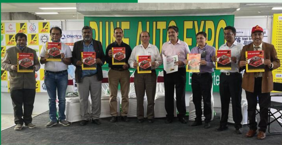
Glimpses of Auto Expo event at Kasarwadi Metro Station

For detail about the Expo and the concurrent conference programs please visit www.puneautoexpo.in